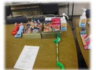
2024年1月に実施した地域交流イベント「打楽器コンサート」