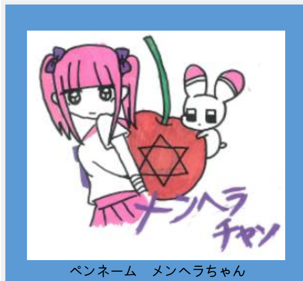
ペンネーム メンヘラちゃん

今回のスポーツプログラムは5月19日(金)の13:00に食堂へ集合し、ミーティングをしてから糀谷文化センターに行く予定です。最近卓球やバドミントンのゲームをしたり、インディアカという羽の付いたボールを手で打ちあうスポーツなどをやっています。興味のある方はぜひご参加ください。